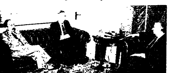
غولدينغ مع الهراوي (اليمين واليسار)